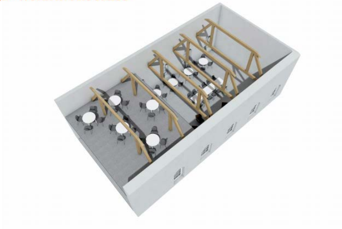
3D - WORK IN PROGRESS