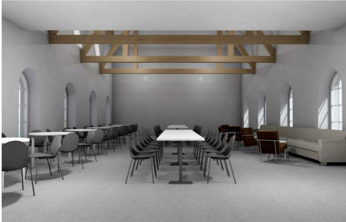
3D - WORK IN PROGRESS