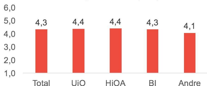
Hvor tilfreds eller utilfreds er du totalt sett med Studentsamskipnaden i Oslo og Akershus (SiO)

440 Resultatene er noe bedre på de store institusjonene, noe som sannsynligvis har sammenheng med 441 antall tilbud og nærheten til tilbudene.