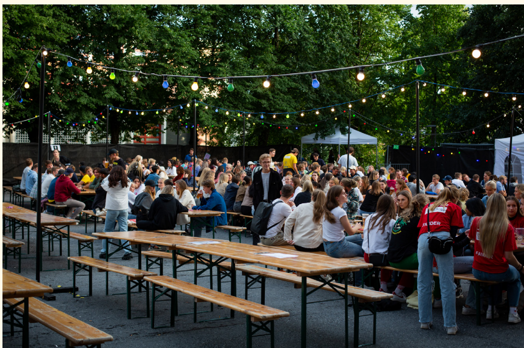
Studentfestivalen i Oslo ombygde parkeringsplassen i “grisebukta” til uteservering for byens nye studenter, og værgudene velsignet arbeidet de la ned.

Studentfestivalen i Oslo er en kulturfestival for byens nye studenter, og har blitt arrangert hver august siden 1989. Den lot seg ikke stoppe av pandemi i verken 2020 eller 2021. Årets festival hadde bedre vilkår enn fjorårets, med mulighet for opp til 600 besøkende på uteserveringen, 500 på konsert i Storsalen og 110 på konsert i Betong. Mellom 16.-21. august ble det avholdt 8 konserter, en rekke quizer, DJ-set, filmvisninger og stand up-show, og uteserveringen ble raskt fylt opp av nye studenter og faddere. Styret og produksjonen opplevde betydelige utfordringer med tolkning og implementering av eksisterende og nye restriksjoner, som i perioden skiftet hyppig. Årets festival ble allikevel en udelt suksess for både gjester, frivillige og ansatte.