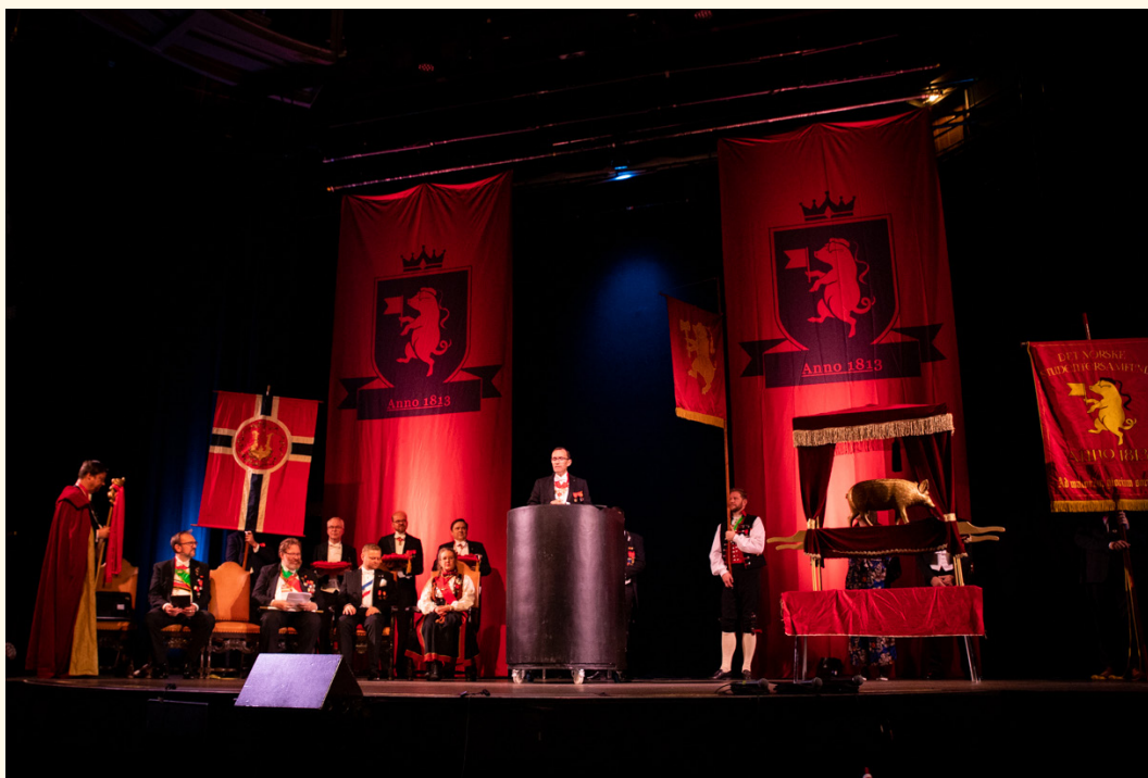
H.M. Grisen avla studentene et besøk under den 22. ordinære grisefest den 02.10.2021, som for anledningen ble avholdt på Chateau Neuf.

Grisefest er en galla som avholdes hvert fjerde år for studentersamfundets medlemmer og alumnier, og finner vanligvis sted i Universitetets aula og på Gamle Logen. I anledning jubileet, ble både festen og seremonien lagt til Chateau Neuf.