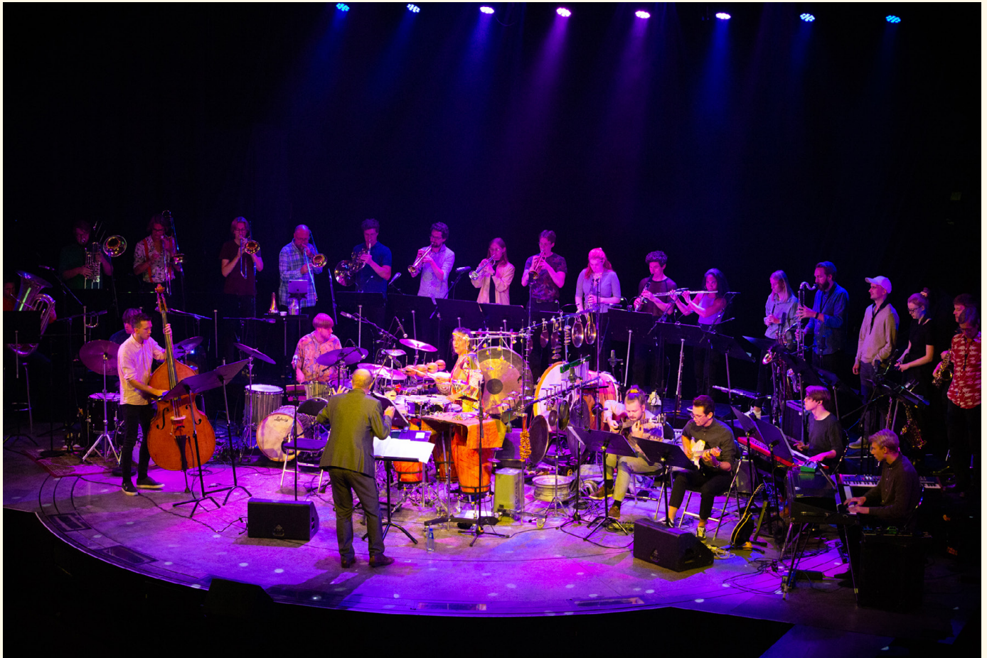
Marilyn Mazur og NMHs grandiose storband holder jubileumskonert i Storsalen i anledning Chateau Neufs 50-årsjubileum, den 03.09.2021.