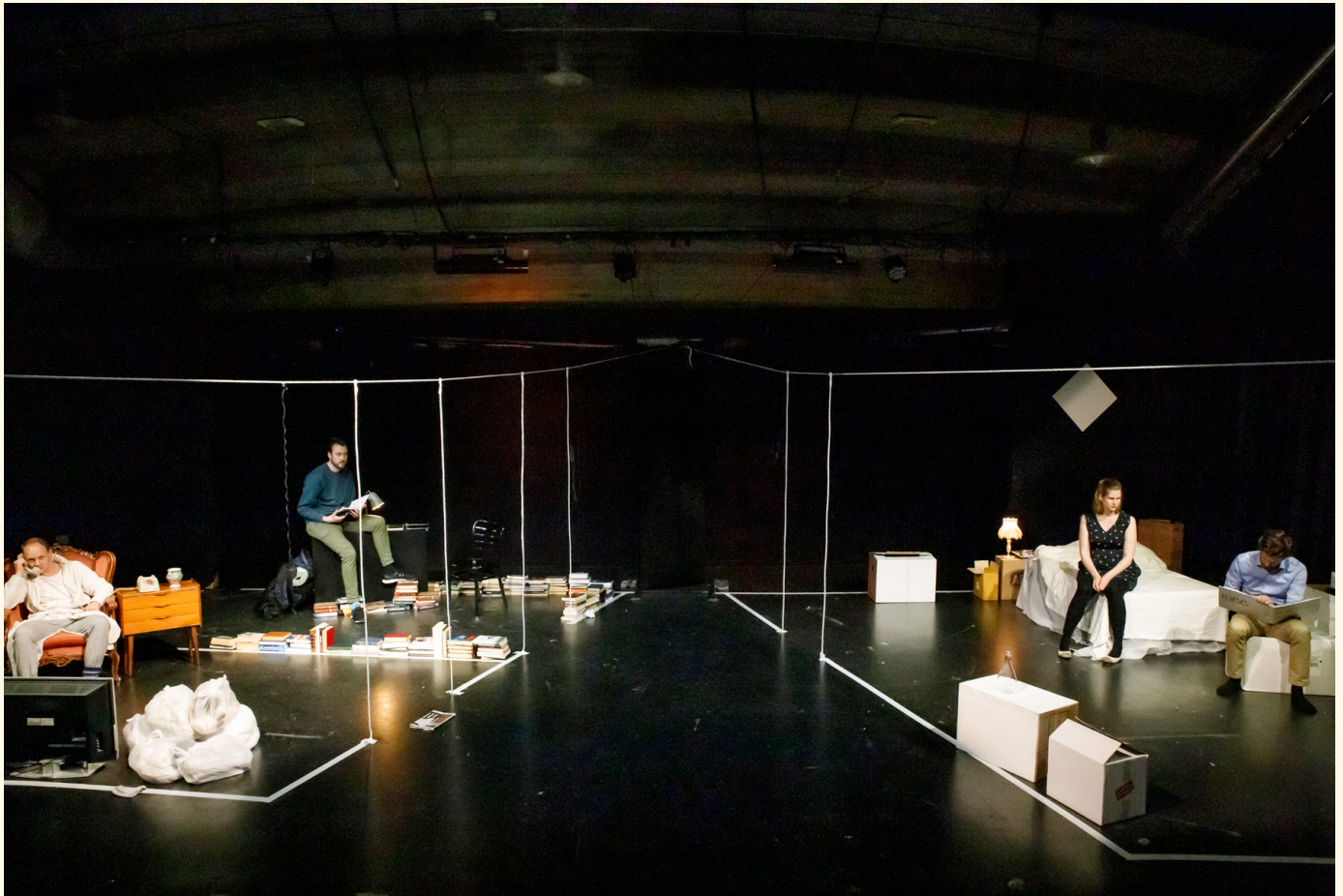
Teater Neuf, landets eldste studentteater, satt i oktober opp stykket "Døren er åpen" i blackboxen på Chateau Neuf.