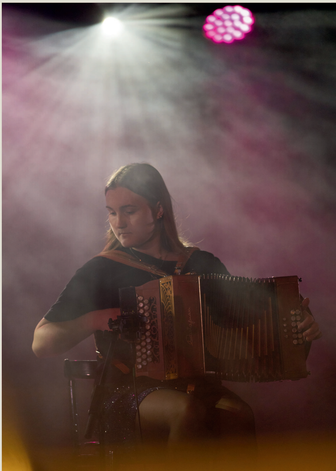
Amalie Kinsarvik Tvilde og Ljøsblått 2022 i Betong.