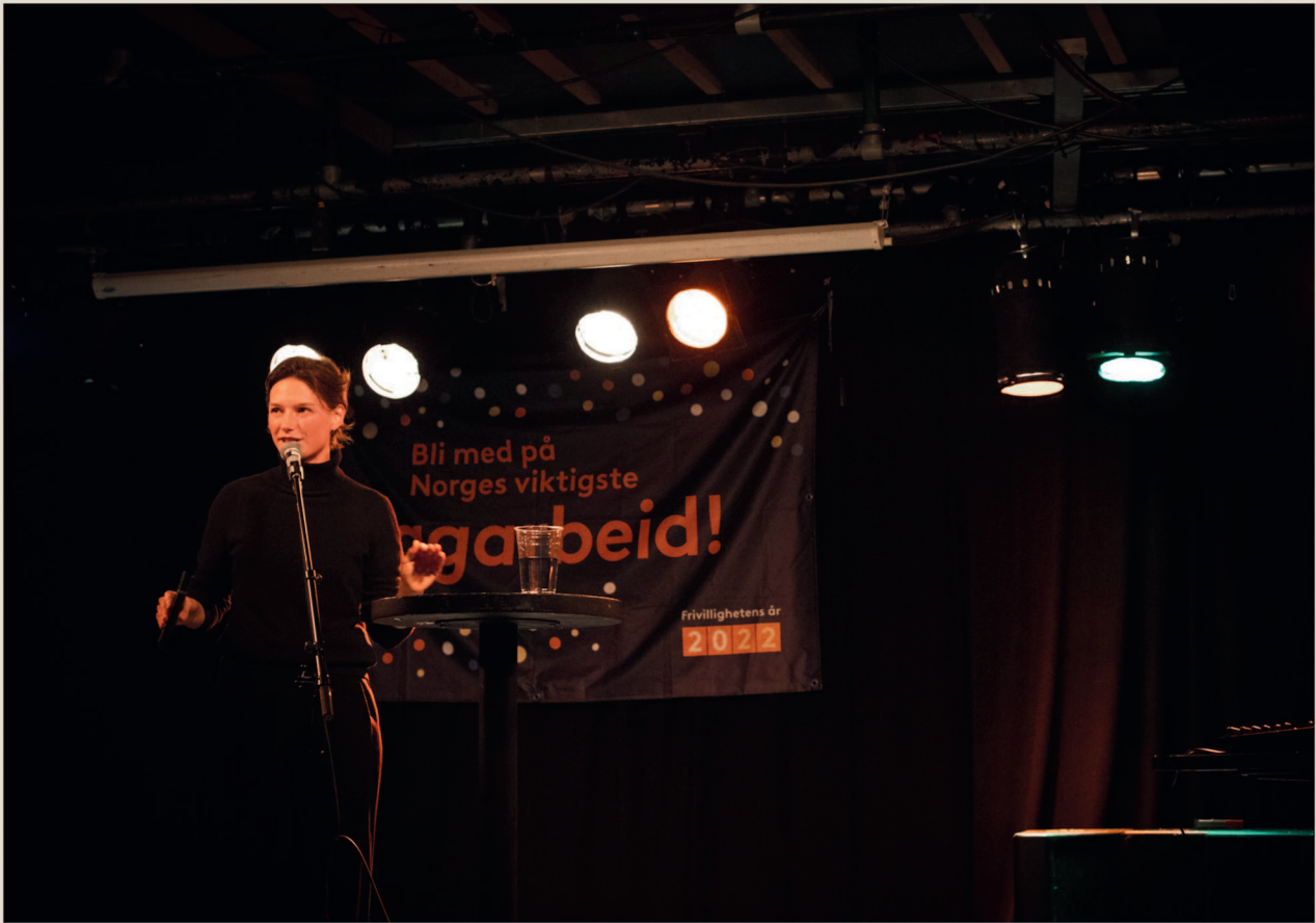
Fra Studentenes frivillighetsdag og konsert med Safario under STUDiO.