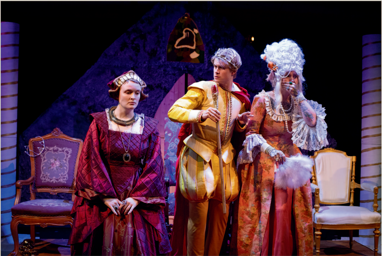
Fra Teater Neuf sitt teaterstykke Kongen dør, på Teaterscenen.