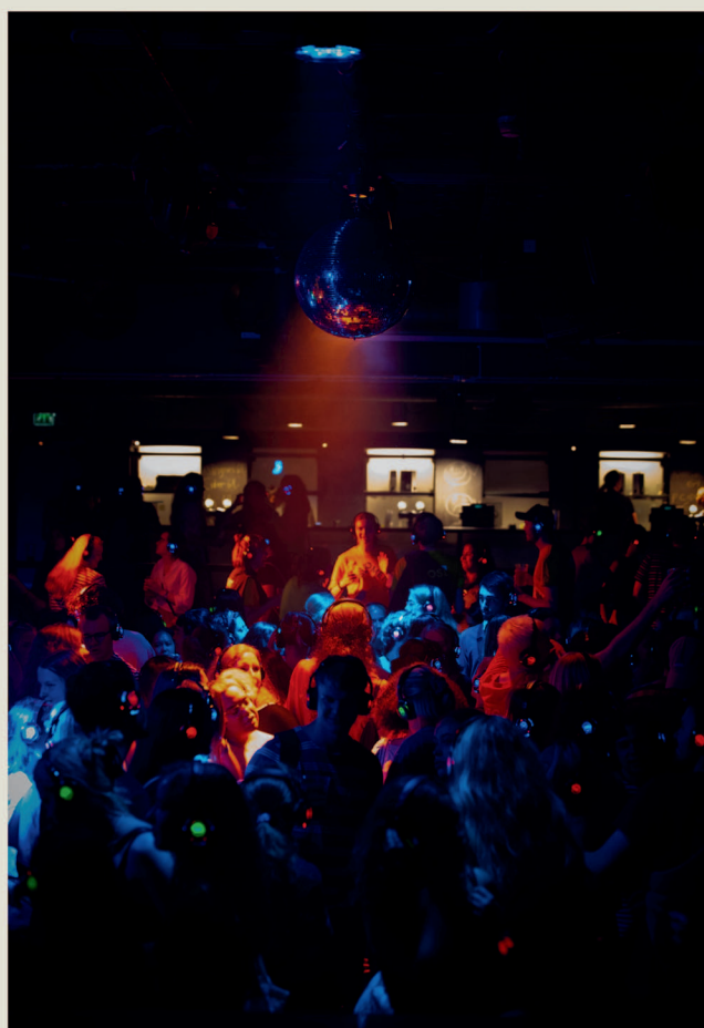
Fra Karaokeparty, Silent Disco og konsert med Rebmoen under Studentfestivalen